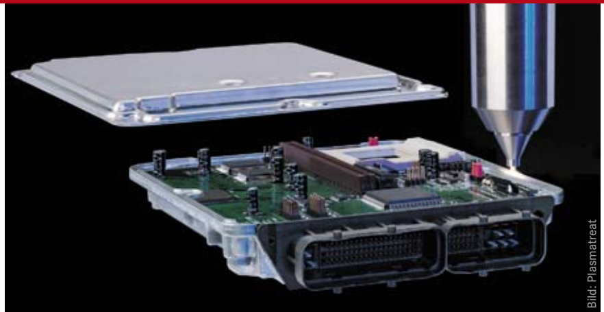
▲ Die Vorbehandlung und Aktivierung der Gehäusefügeflächen mit Openair-Plasma vor dem Aufbringen des Klebstoffes bewirkt eine optimale Dichtigkeit der Elektronikverpackung.

Um elektronische Bauteile unter so harten und wechselhaften Betriebsbedingungen zu schützen und eine lange Funktionsdauer zu gewährleisten, werden Bauteile mit geeigneten Massen vergossen bzw. durch Abdichtung vor Umwelteinflüssen geschützt. Dabei ist es wichtig, den Verguss fehlerlos zu gestalten, was vor allem bedeutet, dass es keine Lufteinschlüsse, Risse oder Ungleichmäßigkeiten im Verguss geben darf. Ein erfolgreicher Verguss ist allerdings nicht nur vom Vergussmaterial bzw. der Vergussanlage abhängig, sondern auch von der Oberfläche des Bauteils, auf der vergossen werden soll. Die Haftung zwi-