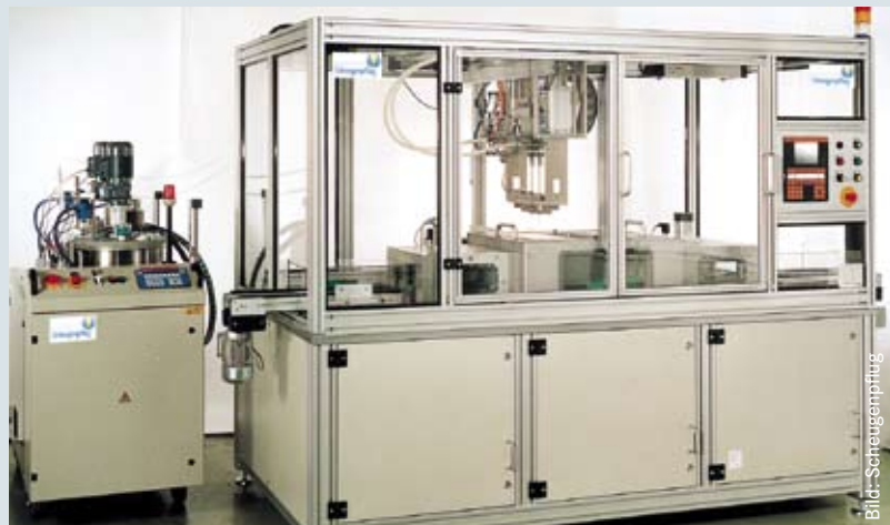
▲ Bild 3: Inline Vakuummkammer erweiterbar für alle Fertigungsschritte vor bzw. nach dem Verguss