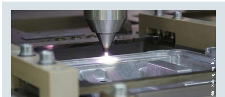
▲ Bild 1: Die atmosphärische Plasmabehandlung wird schon seit langem als einfach zu handhabendes Inline-Verfahren in automatisierten Prozessen eingesetzt

Der zweite Effekt besteht in einer Aktivierung der Oberfläche. Die ionisierte Luft, die das Plasma bildet, besteht zu einem erheblichen Teil aus äußerst reaktiven Sauerstoffionen und -radikalen. Diese Teilchen reagieren an der Oberfläche mit dem Kunststoff des Werkstücks und verändern sie sowohl physikalisch als auch chemisch. Zum einen wird dadurch die Oberflächenspannung so erhöht, dass die Vergussmasse in jede feinste Vertiefung der Werkstückoberfläche fließt. Zum anderen wird die Oberfläche sehr reaktiv, sodass sich zwischen ihr und der erhärtenden Vergussmasse feste chemische Bindungen ausbilden können. Beide Effekte gemeinsam sorgen für eine innige Verbindung zwischen Vergussmasse und Gehäuse, sodass die Bindung zwischen diesen beiden unterschiedlichen Materialien ebenso groß wird wie innerhalb der Vergussmasse selbst.